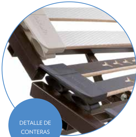
DETALLE DE CONTERAS