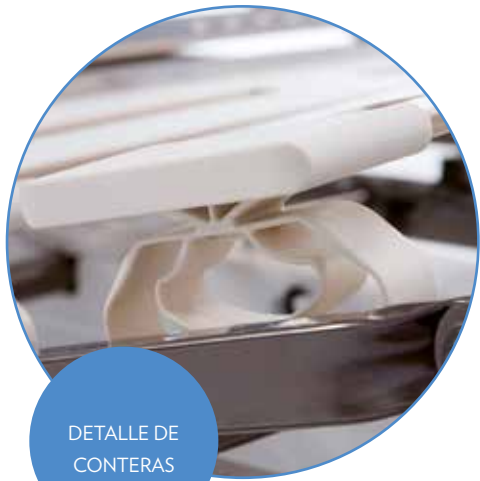
DETALLE DE CONTERAS