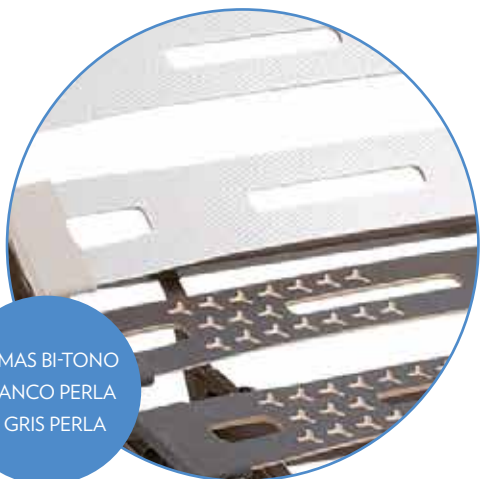
LAMAS BI-TONO BLANCO PERLA Y GRIS PERLA